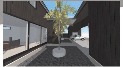
融雪スクエアのある中庭